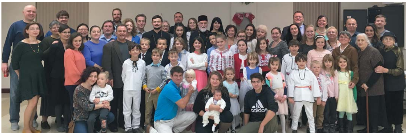
Tineri și părinți din Parohia Sf. Maria, St Paul, MN la programul aniversar sărbătorind Centenarul Marii Uniri - 13 octombrie 2018.