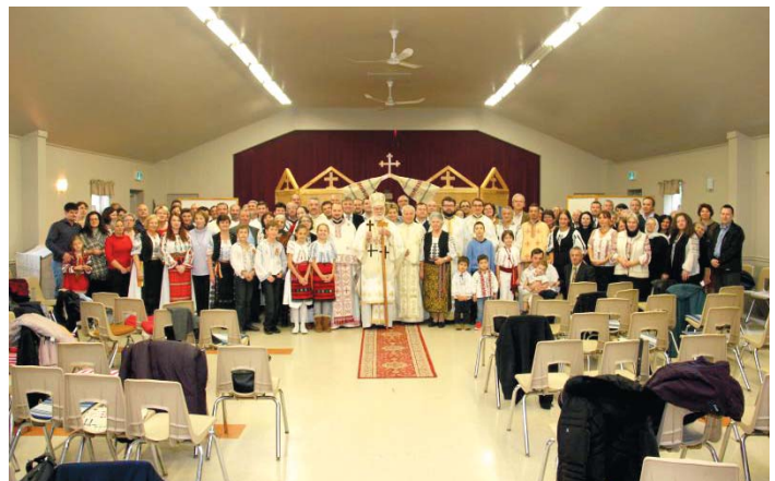
Aniversarea de 5 ani a Parohiei Sf. Luca din Markham, Ontario, Canada - 27 octombrie 2018.