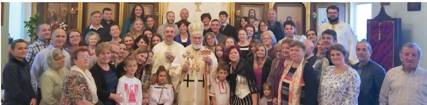
Vizită pastorală în Parohia Sf. Cruce din London, Ontario, Canada - 28 octombrie 2018.