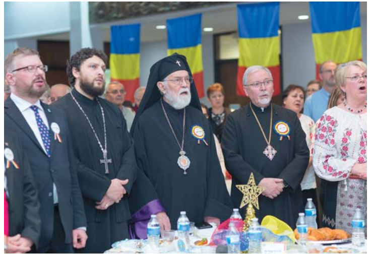
Sărbătorirea Centenarului Marii Uniri la Catedrala Sfânta Maria din Cleveland, Ohio, 1 decembrie 2018, parastas pentru Eroii Neamului și Momentul Aniversar.