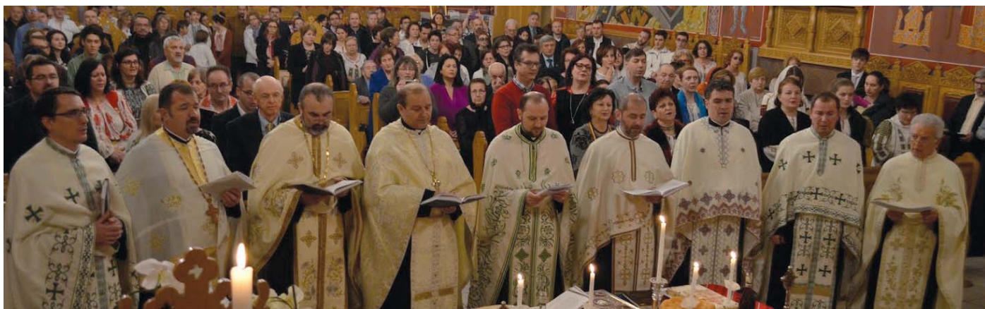
Centenarul Marii Uniri sărbătorit de preoții Protopopiatului Canada Centrală în Parohia Sf. Gheorghe, Toronto, Canada - 1 decembrie 2018.