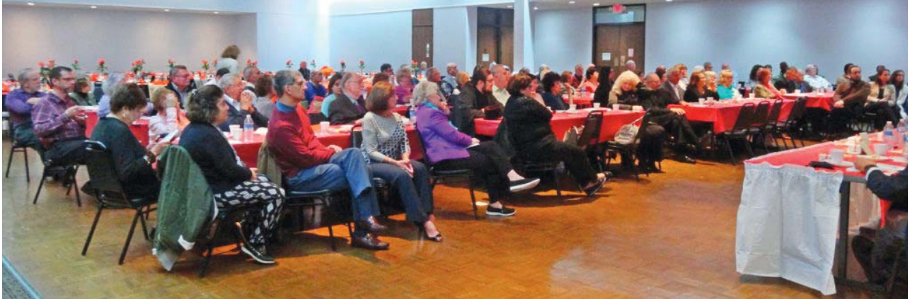
Attendees at the 31st OCL Conference in Cleveland.

The hospitality and participation of the Orthodox faithful of all jurisdictions in the city of Cleveland on the weekend of October 19-20, 2018, was overwhelming! Over 170 faithful people of all jurisdictions participated in a program showing all of us what we can truly accomplish when we work in unity. You can see and feel the unity and love by calling up each speaker's presentation and the short overview video that is posted on OCL's YouTube channel ( https://www.youtube.com/user/oclaity/videos ). Cleveland is a model of Pan-Orthodoxy living and working in practical and meaningful ways. These videos are presented as paradigms, so that you can develop your own unique programs in your community. They model best practices at work.