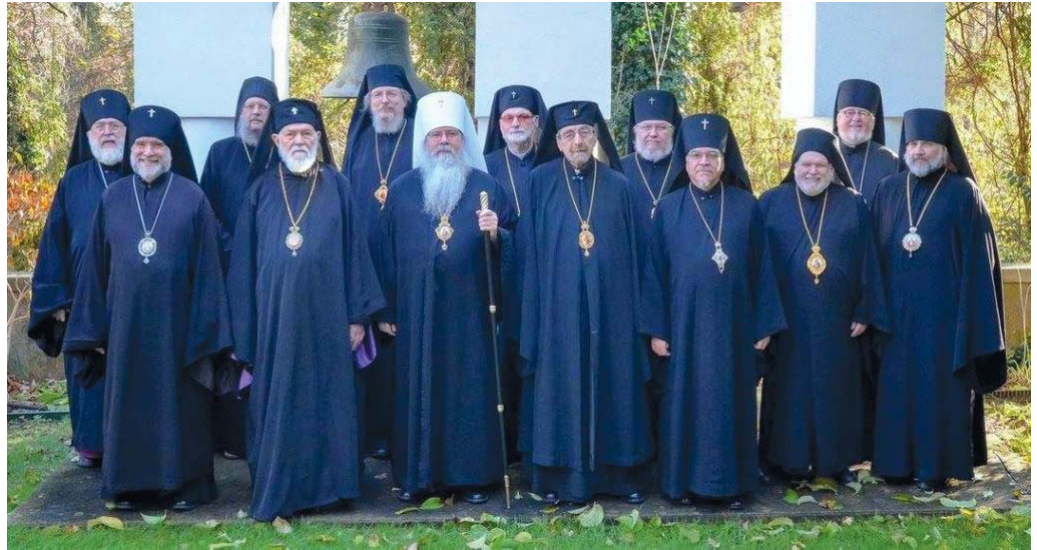
Holy Synod of Bishops of the Orthodox Church in America