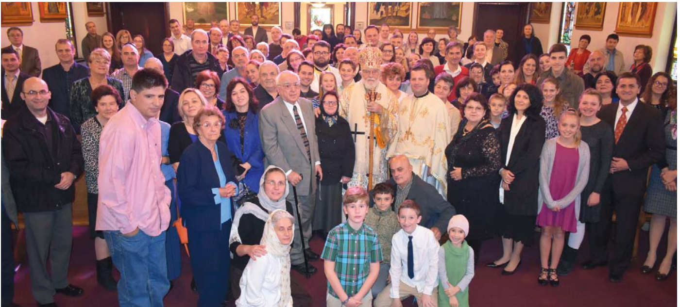
Aniversarea de 105 ani a Parohiei Pogorârea Duhului Sfânt, Elkins Park, PA - 4 noiembrie 2018.